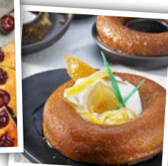
Le baba au rhum