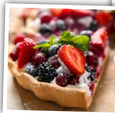
La tarte aux fruits

Les + de 50 ans affichent leurs préférences pour des recettes plus « traditionnelles » comme la tarte aux fruits (2 e du classement des 50 à 64 ans et 1 ère chez 65 ans et plus), le clafoutis (2 e du top des 65 ans et plus) ou le baba au rhum qui apparaît en 3 e position de ces deux catégories.